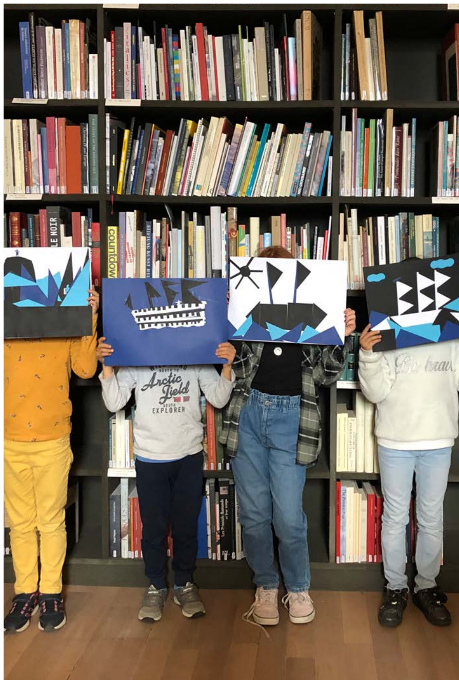
Photo de l'atelier autour de l'exposition "Lyonel Feininger - La ville et la mer", Musée Jenisch à Vevey