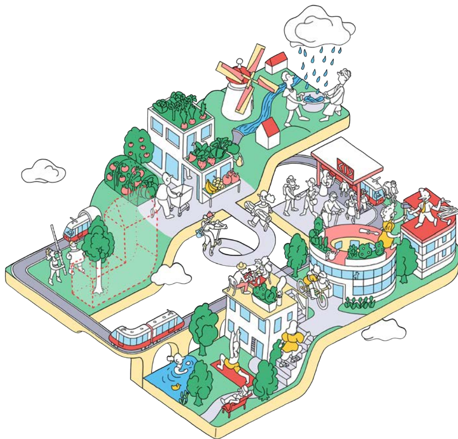
Illustration développée pour les thématiques de la «Cité Idéale» @tomas.studio