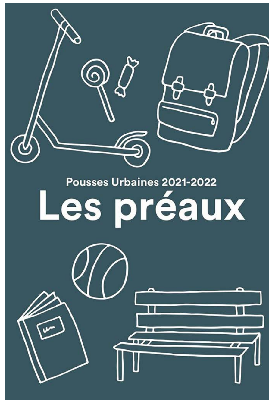
Flyer de l'édition Pousses Urbaines «Les préaux» @Plates Bandes communication

Les ateliers avec les adultes ont commencé fin 2021 et ceux avec les enfants en mars 2022. Les restitutions se dérouleront en juin et donneront lieu à des recommandations qui permettront d'accompagner la nouvelle politique des préaux de la Ville de Lausanne.