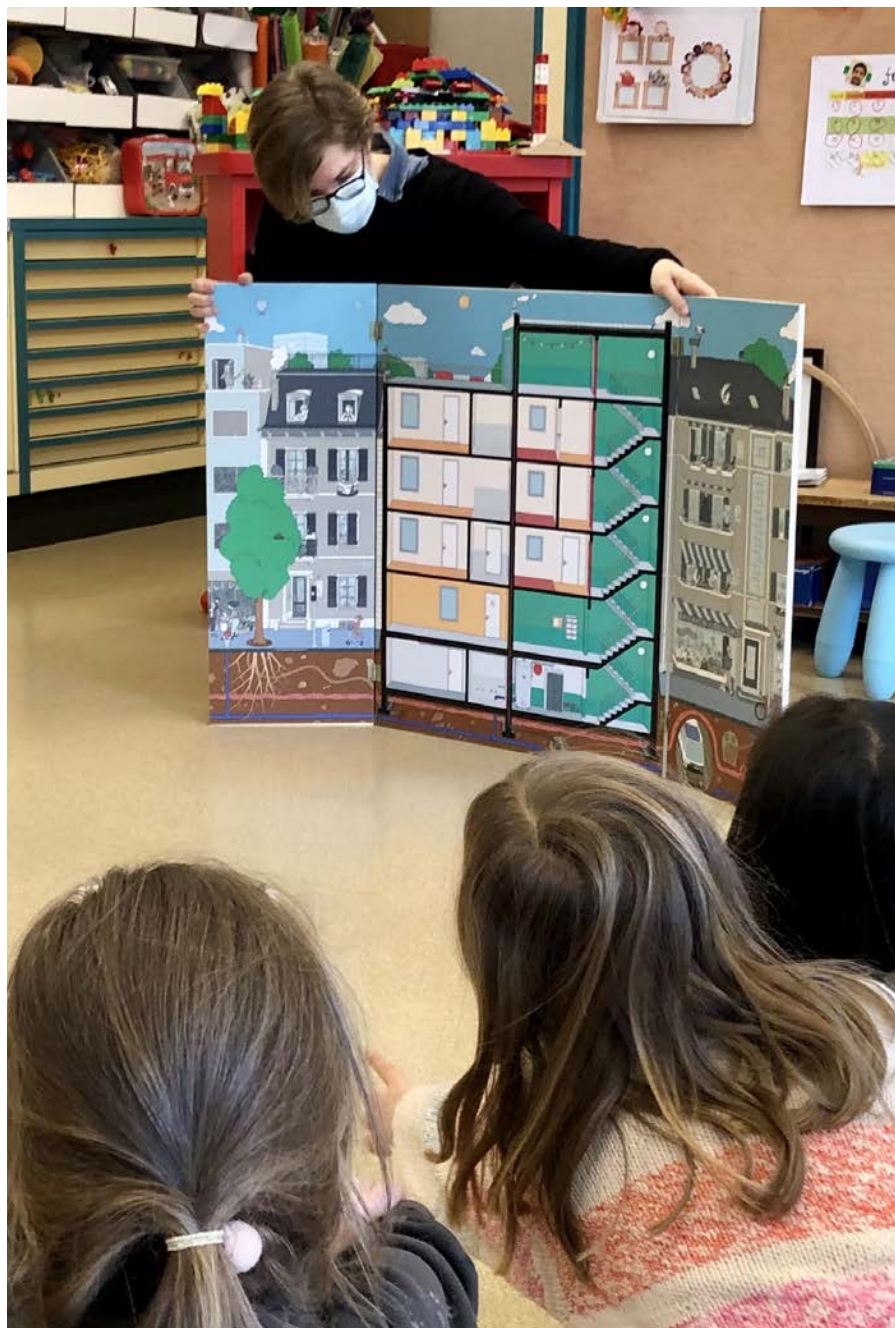
Cours «L'immeuble», classe de 1-2P au collège de Mon-Repos Nouvelle maquette développée avec tomas.studio.