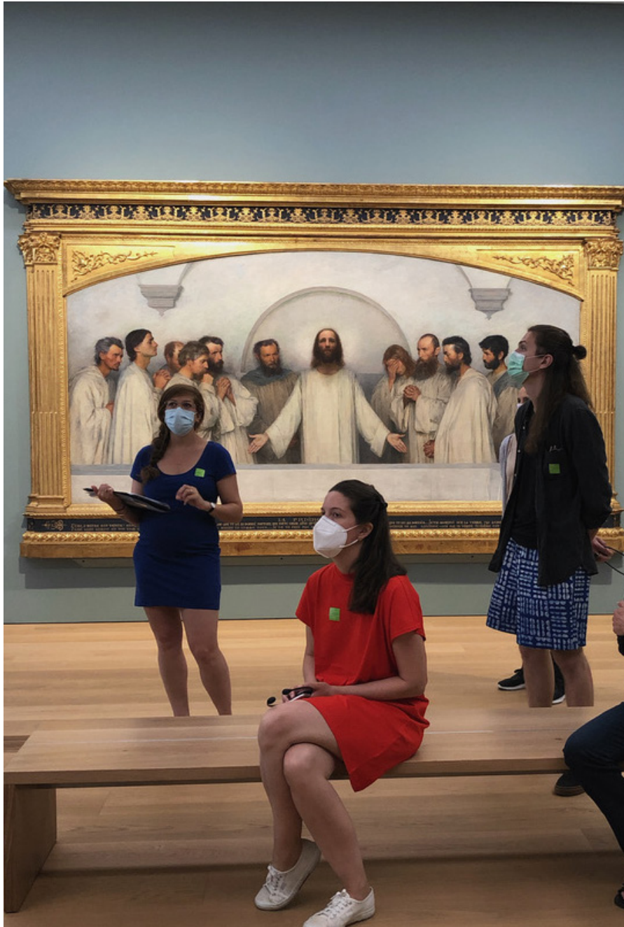
Visite guidée du bâtiment du Musée Cantonal des Beaux-Arts de Lausanne