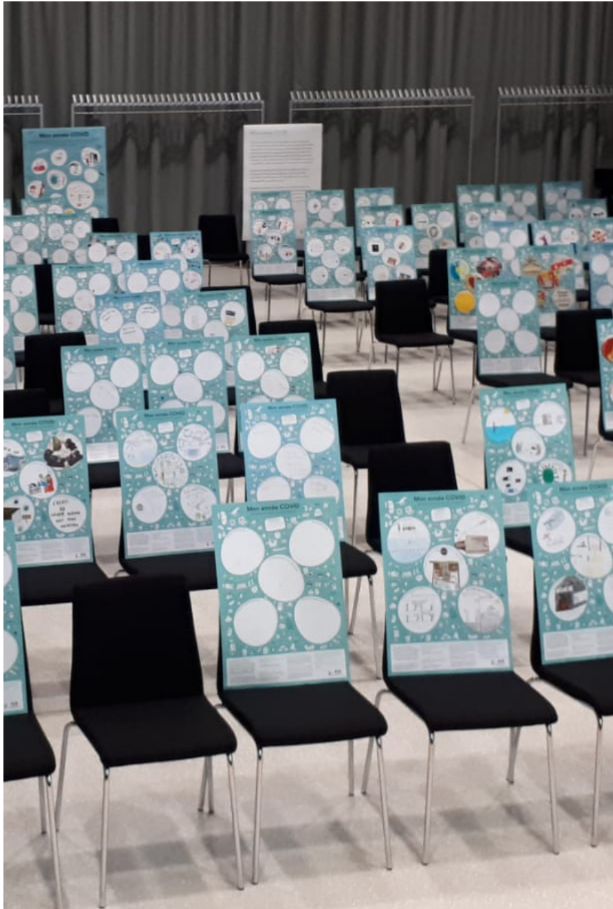
Exposition des affiches au Musée Cantonal des Beaux Arts