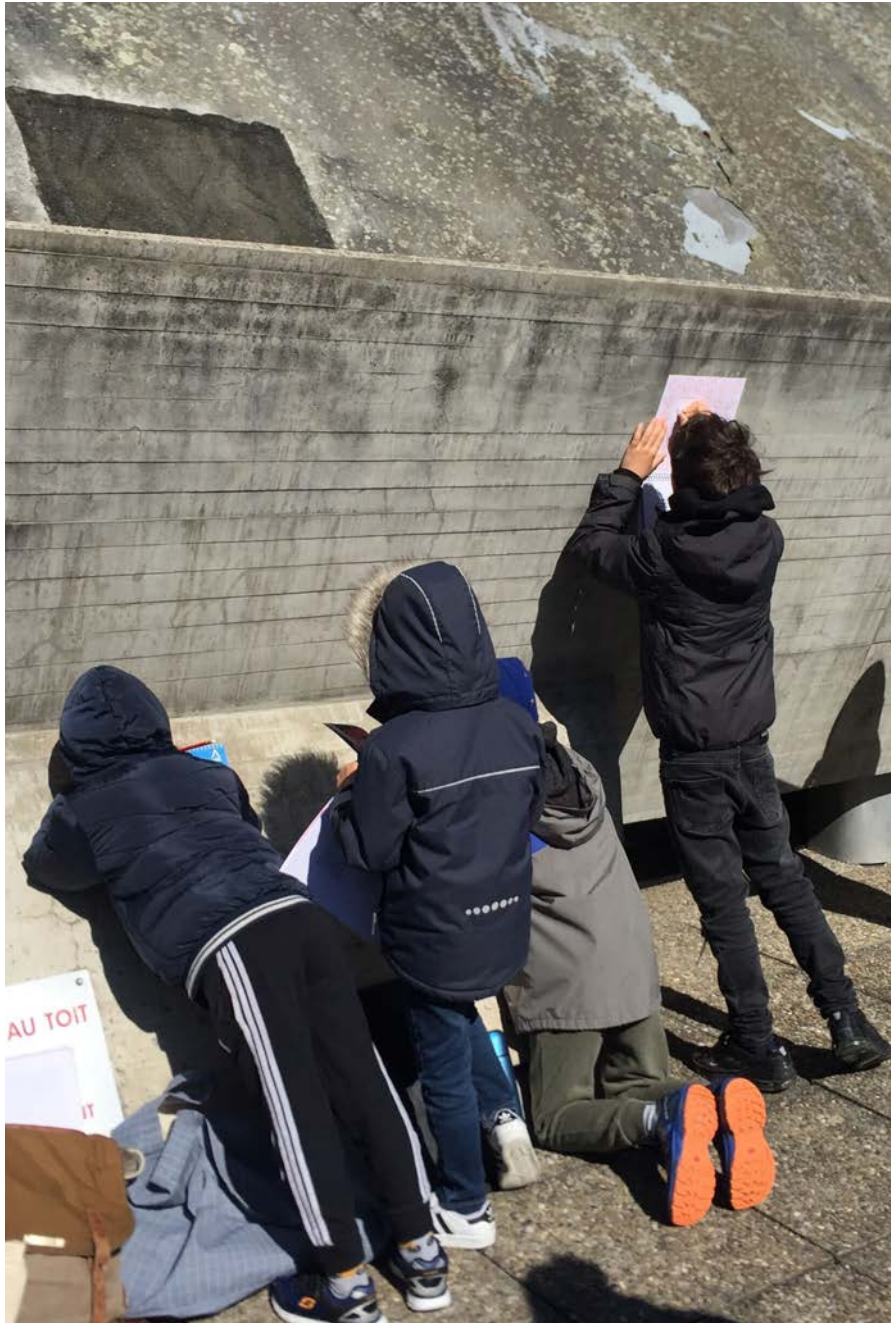
Fin du grand jeu «A la recherche des temps modernes» avec un des groupes du Centre Aéré d'été de Béthusy.