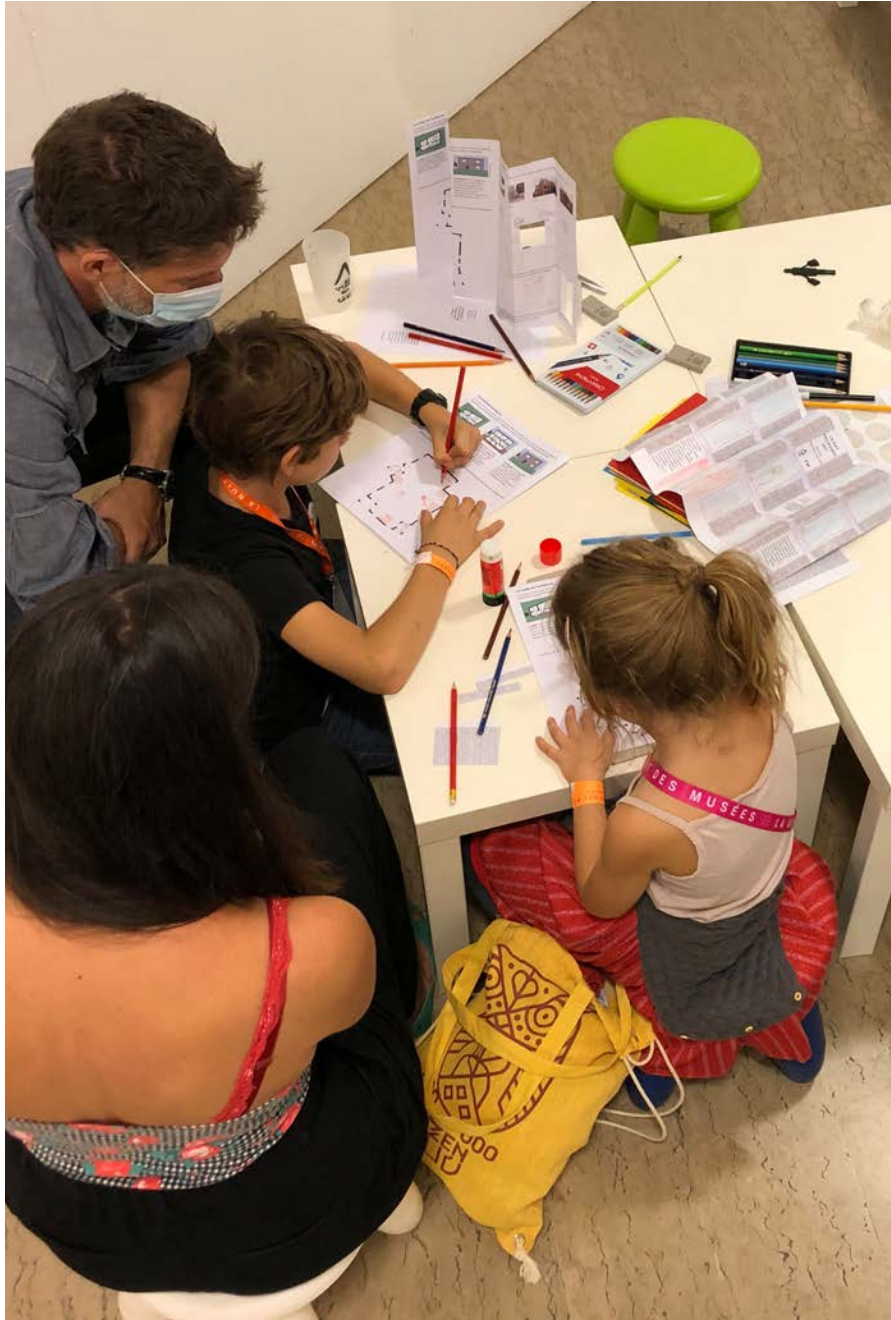
Atelier autour de l'exposition "The Practice of Architecture" du bureau Sergison Bates, F'AR