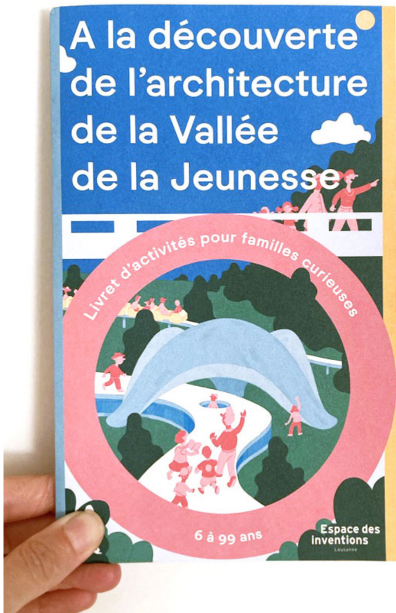
Couverture du de la balade jeu «A la découverte de l'architecture de la Vallée de la Jeunesse»