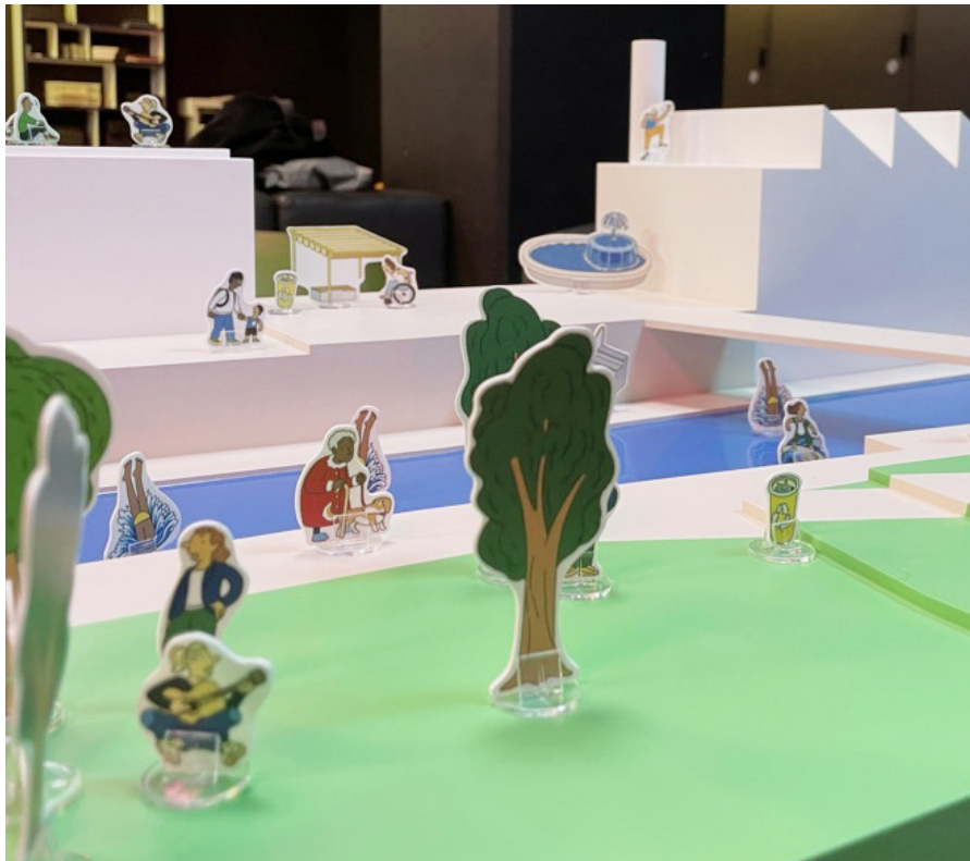
Flyer et photo d'une des maquettes réalisées pour les ateliers autour de l'exposition «Riding the Olympic Wave»