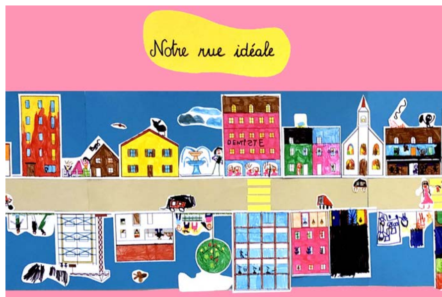
Maquettes et collages réalisés par les classes lors du programme Projet Éducatif