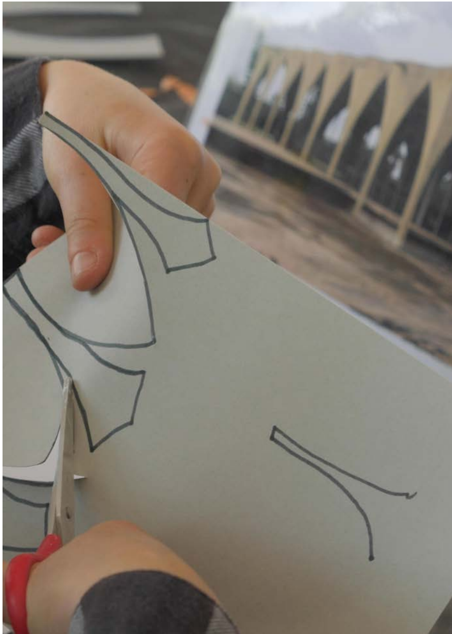
Atelier «Maladière moderne» à l'édicule de la Maladière, Lausanne

Dans ce sens, une série de 5 formats distincts pouvant être combinés ou appliqués de manière indépendante pour sensibiliser les enfants à l'architecture moderne accompagnent ce rapport :